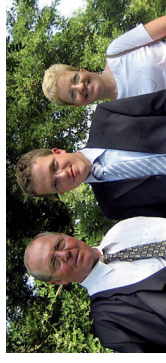
„Unser „Riesling Spätlese Feinherb“ wurde bereits mit einer „Silbermedaille“ (sehr gut) bei der internationalen Weinchallenge 2008 der Fachzeitung „Selection“ ausgezeichnet.“