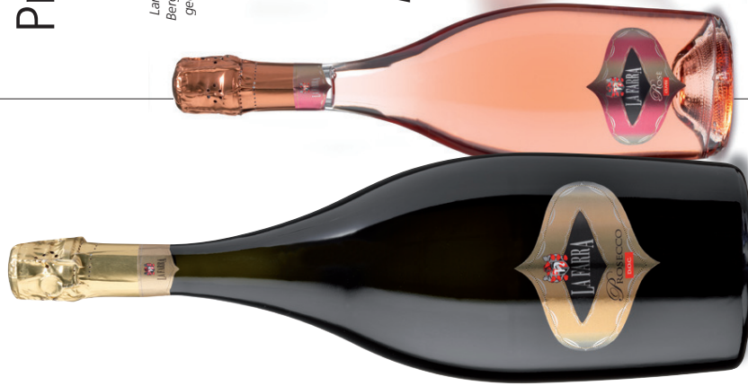
In der reizvollen Landschaft am Fuße der Berge von Farra di Soglio gedeihen die Weine des Hauses Nardi