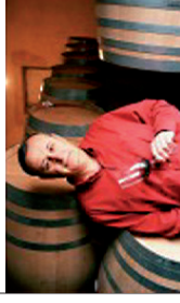
Der 1935 gegründete Familienbetrieb gehörte schnell zu den fortschrittlichsten der Region. Heute, drei Generationen später, sind die Bodegas Bleda noch immer ein Familienbetrieb.

Die Vinifikation der Weine erfolgt bei kontrollierter Gärung in Edelstahl-tanks, der spätere Ausbau findet in Holzfässern aus französischer und amerikanischer Eiche statt. Die Weine der Bodegas-Bleda präsentieren sich ausgesprochen Fruchtig und Seidenweich.