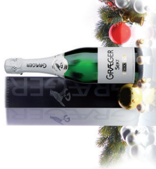
Graeger Sekt Trocken 0,75 l in Präsenthülle EUR 5,05