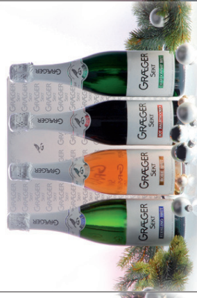
Graeger Sekt Premium Selection 3 x 0,75 Flaschengärung EUR 17,05