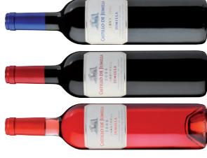
Spanische Weine aus der DO Jumilla EUR 27,60