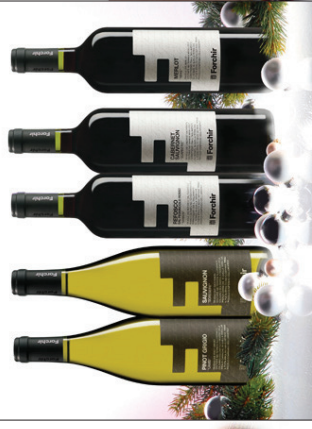
Italienische Weine aus dem Friaul in Holzkiste 3 x 0,75 l Pinot Grigio, Sauvignon Blanc, Refosco EUR 18,80