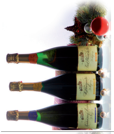
Graeger Sekt Sektkultur 3 x 0,75 Traditionelle Flaschengärung Chardonnay / Riesling, Weißburgunder, Pinot Blanc de Noir EUR 30,00