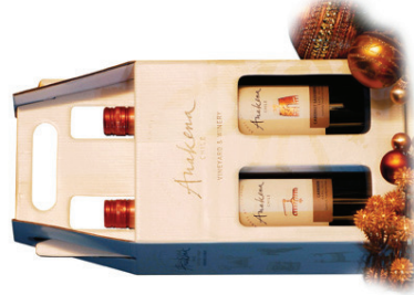
Chilenische Weine aus dem Rapel Valley in attraktiver Sichtverpackung 2 x 0,75 l Sauvignon Blanc, Carmenère EUR 8,40