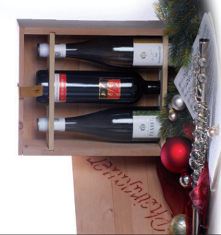
Rheingauer Weine vom VDP Weingut Fendel in Holzkiste 3 x 0,75 l Fum Allernnerschite, Rüdesheimer Klosterlay Feinherb, Assmannshäuser Spätburgunder EUR 25,95