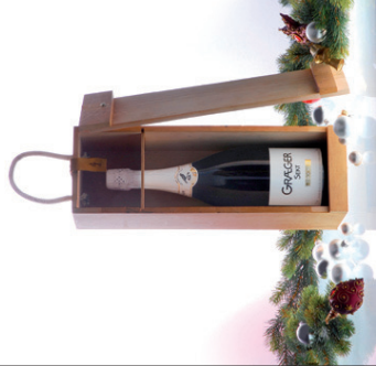
Graeger Sekt Trocken 1,5 l in stabiler Holzkiste mit Tragegriff EUR 20,00