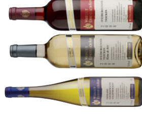
Mittelrheinweine vom Weingut Eisenbach-Korn in Holzkiste 3 x 0,75 l Riesling Hochgewächs Halbtrocken, Spätburgunder Blanc de Noir Trocken, Spätburgunder Rot Trocken EUR 22,55