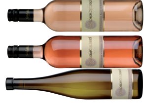
Rheinhessenweine vom Weingut Schlossmühlentof in Holzkiste 3 x 0,75 l Alzeier Wartberg Riesling Spätlese Feinherb, Alzeier Wartberg Portugieser Weißb. Feinherb, Grauer Burgunder QW Trocken EUR 22,15