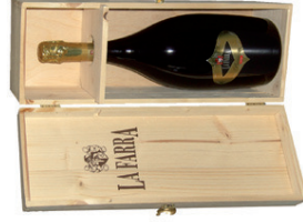
Prosecco Spumante de Valdobbiadene D.O.C.G. Brut 1,5 l mit attraktiver Präsenthülle in schwarz / gold EUR 15,00