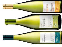
Naheweine vom Weingut Pieroth in Holzkiste 3 x 0,75 l Gutsckwee Trocken, Weißburgunder Trocken, Bingerbrücker Römerberg Riesling Spätli. Lieblich EUR 23,40