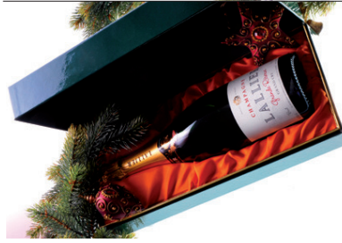
Champagne Lalier Grand Reserve 0,75 l in hochwertiger Kassettenbox EUR 23,50