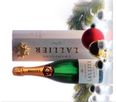
Champagne Lalier Premier Cuvée 0,75 l in Präsenthülle EUR 18,50