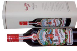
Crème de Cassis in Metalldose 0,70 l EUR 12,60